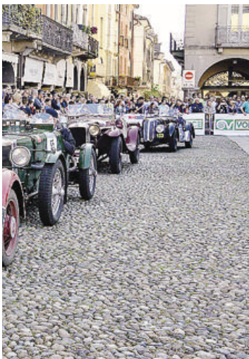
La sfilata delle auto storiche in piazza della Vittoria a Lodi: la Mille Miglia per vetture d'epoca torna nel cuore della città per ripetere lo straordinario successo del 2016 quando il centro fu invaso da migliaia di appassionati

« Il pilota di Graffignana vinse le edizioni del 1928 e del 1929, un incidente a Monza gli costò la vita nel 1933